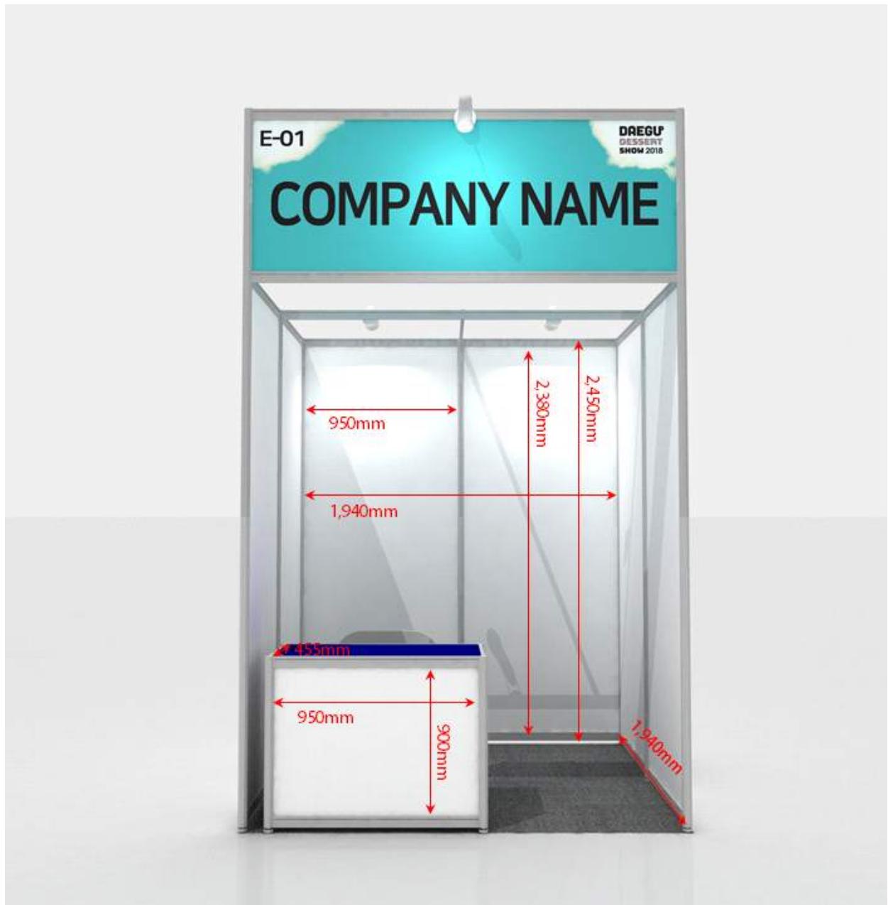
2m*2m 기본 조립부스 크기(대구디저트쇼만 해당)